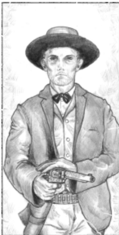
Foto på Jesse James (ornamenteringen på revolvern är intressant...)

Låt gärna den gamla mannen dyka upp då och då under rollpersonens äventyr så länge han har re-