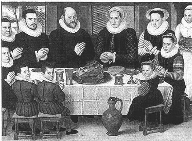
Familjen Hokun. Målning av den nevstriske artisten tem-Logur

Glimferd har funnits ett tag. Staden har fått sitt namn efter ett gammalt ord för vik, och från den glänsande fisk som man hämtar upp här – främst sill och makrill. Fram till Tullfrihetsdeklarationen 718 bodde här ett tjugotal familjer, av vilka de största var Hokun och Vant. Alla var och är plebejer, men Hokun och Vant var och är ganska välbärgade sådana, och de har blivit rikare sedan dess. Dessa familjer och några andra, framförallt Saltetorparna på södra Idelsö, räknas som 'fastborna'. De äger jakt- och liknande rättigheter på själva öarna, och rätten till allt fiske i öarnas direkta närhet. Ett råd av familjerna överhuvuden styr ön när inte Regentens magistrat finns där, och de har Regentens löfte att liktorn och liknande auktoritetsfigurer skall utses från deras led.