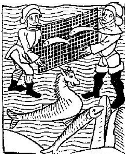
Fiskare. Hippokampen på bilden är ganska orealistisk.

Under Sillaveckorna under början till mitten av Hundens Årstid belamras staden av fiskare och tillfällighetsarbetare vid salterierna och trankokerierna. Fiskarna är såväl tillfälliga arbetare som mönstrar på en större fiskebåt för en dagslön som mindre entreprenörer som har sina egna båtar, oftast mindre. En del övernattar längs södra Flatöns kust istället, eller i de smärre fiskelägen som finns bland öarna, men det är riskabelt och obekvämt. Andra hyses in i stadens bostadshus och sjöbodrar, för att inte tala om det tjugotal stora härbärgen som finns på ön, som vart och ett rymmer trettio till sjuttio gäster med minimala anspråk på utrymme.